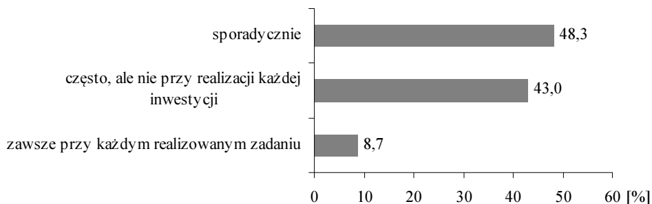
Rysunek 1. Częstotliwość konsultacji społecznych przy realizacji inwestycji

Z kolei z przeprowadzonych badań ankietowych wynika, że zdecydowana większość badanych władz lokalnych (98,2%) od 2007 r. realizowała lub nadal realizuje zadania inwestycyjne. Ze względu na fakt, że realizacja inwestycji powinna służyć społeczności lokalnej, władze samorządowe zostały poproszone o wskazanie, czy i jak często inwestycjom towarzyszyły konsultacje społeczne (rys. 1).